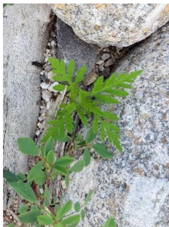
29/05 ambrosie en bord de rivière dans le Gard. Photo Fredon Occitanie.