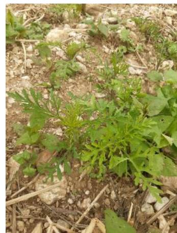
21/05/2021 ambrosies dans un champ dans le Tarn.