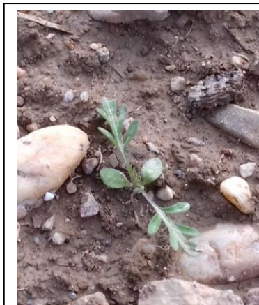
Plantule d'ambrosie : cotylédons arrondis et folioles découpées.

J'ai le plaisir de vous adresser la première lettre d'informations sur les ambroisies 2019 à l'attention des Mairies et des référents-ambrosies du Gard. Bonne lecture à tous.