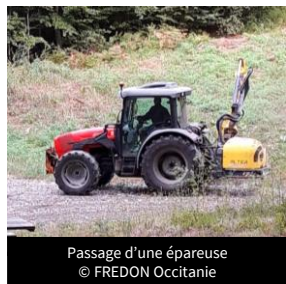
Passage d'une épaveuse