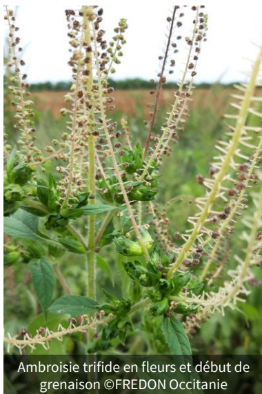
Ambrosie trifide en fleurs et début de grenaison