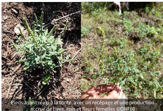
Pieds ayant réagi à la tonte, avec un recépage et une production accrue de tiges, épis et fleurs femelles