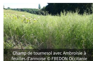
Champ de tournesol avec Ambrosie à feuilles d'armoise