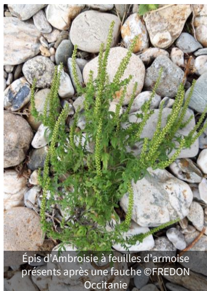
Épis d'Ambrosie à feuilles d'armoise présents après une fauche

C'est donc une période à haut risque de dissémination qui débute ! [ lire article du 06/10 - Alerte ]