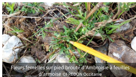
Fleurs femelles sur pied brouté d'Ambrosie à feuilles d'armoise

Les observations fin septembre / début octobre de l'ONF à Rabouillet [voir article du 05/10] ou celles liées au projet d'éco-pâturage à Alès [lire article du 02/10] montrent des plants de faible taille mais ayant recépé, avec une production accrue de fleurs femelles . Cela montre les limites et difficultés de gestion des ambrosies, et tout l'intérêt d'agir dès repérage pour faciliter la lutte.