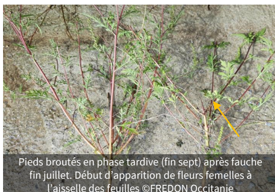
Pieds broutés en phase tardive (fin sept) après fauche fin juillet. Début d'apparition de fleurs femelles à l'aisselle des feuilles